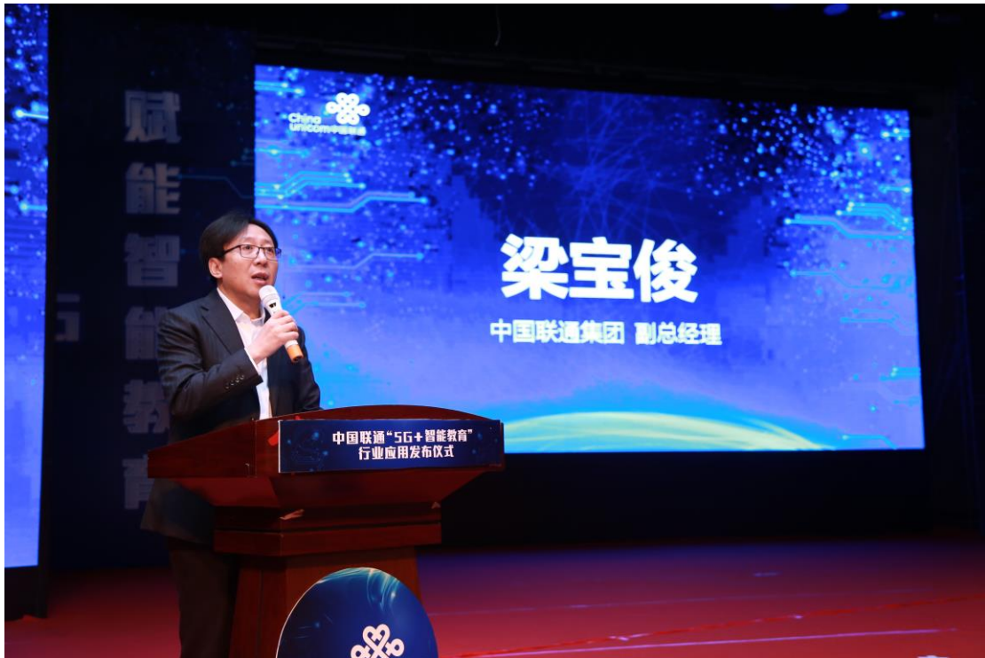
圖為：中國聯通副總經理梁寶俊致辭