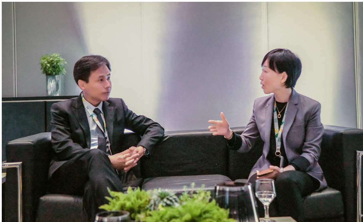
网龙 CEO 熊立博士(左一)与中国联通国际有限公司董事长兼总裁孟树森博士展开会谈

动学习技术。同时，网龙计划在三年内在埃及搭建 26.5 万间移动智慧教室。此外，网龙产品进入印度市场已经多年，超过 10 万间当地教室采用了网龙的数字教育解决方案。网龙还与加拿大、新加坡、日本、尼日利亚、肯尼亚、塞尔维亚等国家的政府部门、教育机构及企业方，签署了合作谅解备忘录或战略合作协议。截至目前，网龙的数字教育业务已覆盖 190 多个国家的 200 多万个教室，注册用户超过 1 亿。